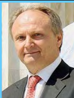
Ο υφυπουργός Αθλητισμού κ. Γιάννης Ανδριανός