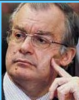
Ο νέος υπουργός Πολιτισμού κ. Κων/νος Τασούλας

Όταν η οικονομία της χώρας καταποντιζόταν, στη ΓΓΑ πολιτικοί προϊστάμενοι, υπάλληλοι και ομοσπονδίες έτρωγαν με χρυσά κουτάλια χωρίς κανένα έλεγχο!