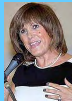
Η γενική γραμματέας Αθλητισμού κα Κυριακή Γιαννακίδου

Εικοσαετές Όργιο Πολιτικών, Αθλητικών και Οικονομικών Εγκλημάτων!