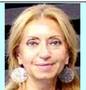
Γερολύμπου Αναπληρώτρια Πρόεδρος.