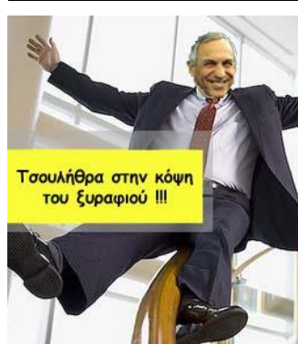
Τσουλήθρα στην κόψη του ξυραφιού !!!

Δεν μπορείτε να ισχυρισθείτε ότι ΔΕΝ γνωρίζετε! ΓΝΩΡΙΖΕΤΕ ΟΛΟΙ και ΣΥΜΜΕΤΕΧΕΤΕ στη μεγάλη αθλητική απάτη ΣΥΝΕΙΔΗΤΑ και επί πολλά χρόνια!!! Στηρίζετε το Αρχι-Καραλαμόγιο αριστερά και τους συνενόχους του για δικά σας προσωπικά οφέλη εύνοιας και ιδιαίτερης μεταχείρισης! Με την ψήφο του συλλόγου σας του δίνετε τη δύναμη να εφαρμόζει τα αρρωστημένα του βίτσια επί των αντιπάλων του! Είσαστε το ίδιο ένοχοι με αυτόν!!! Έχετε απόλυτη υποχρέωση να συμμετέχετε ΝΟΜΙΜΑ στις Γενικές Συνελεύσεις και με την ψήφο σας να επιβάλλετε το ΔΙΚΑΙΟ στην πορεία της ομοσπονδίας και στη συγκεκριμένη περίπτωση είχατε υποχρέωση να παρουσιαστείτε και να ψηφίσετε υπέρ της ΜΗ ΔΙΑΓΡΑΦΗΣ των πέντε συλλόγων!!! Τους κλείσατε τα "σπίτια" εν ψυχρώ!!!