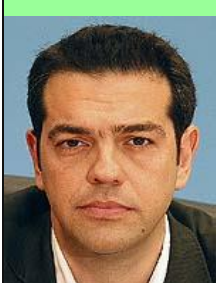
Ο πρωθυπουργός της Κωλοτούμπας Αλέξης Τσίπρας