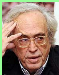
Ο Υπουργός Πολιτισμού & Παιδείας της Κωλοτούμπας Αριστείδης Μπαλτάς