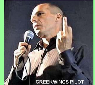
"Το χρέος που περπατάει" αποτελεί την αιχμή του ... δόρατος της χώρας μας!!!