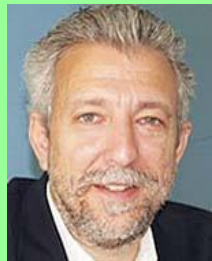
Ο Υφυπουργός Αθλητισμού της Κωλοτούμπας Σταύρος Κοντονής