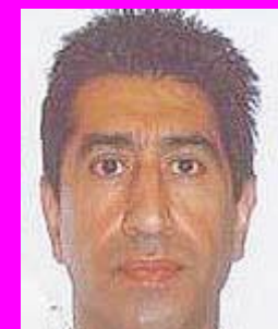
12-Γκάζι, Διευθυντής αθλήματος, νόμιμος προπονητής, παράνομα ψηφίζει!!!!