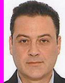
8-Καρβούνης Παράνομος Εφ. Εθν. Ομάδων, διότι προπονητής!