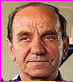
5-Βόβλας Παράνομος Ταμίας διότι προπονητής!