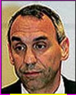
0-Γερόλυμπος ΑΦΑΝΗΣ ΔΙΚΤΑΤΟΡΑΣ