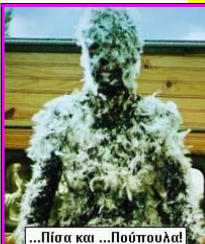
...Πίσσα και ...Πούπουλα!

(Ορολογία: "Αρπαχτή" σημαίνει μπαίνεις μέσα αρπάζεις, φεύγεις και χάνεσαι! "Αρμεχτή" σημαίνει μπαίνεις μέσα, αράζεις, αρμέγεις τον πρώτο μήνα, αρμέγεις το δεύτερο μήνα, αρμέγεις τον τρίτο μήνα, κ.ο.κ.)