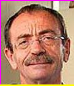
1-Μπουλούμπασης Παράνομος Πρόεδρος διότι προπονητής!