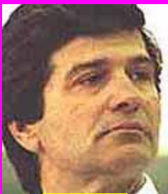
10-Πάσης Νόμιμη ... Σουπιτιά! Παράνομος, διότι προπονητής!