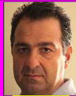
13-Σκοπελίτης Ιδιοκτήτης "Sportdata", εξωτερικός συνεργάτης!!!