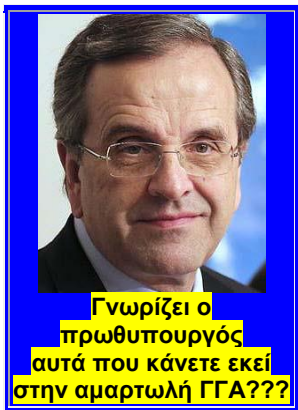
Γνωρίζει ο πρωθυπουργός αυτά που κάνετε εκεί στην αμαρτωλή ΓΓΑ???

17-ΝΤΟΚΝΤΑ 18-ΕΘΝΟΣ 19-Δίκη/ΣΚΑΙ 20-Δίκη/ΣΚΑΙ 21-ΝΤΟΚΝΤΑ 22-karate.gr: Πόρκομα Ρακιντζή 23-Κουτί Πονδύρα 24-karate.gr: Πόρκομα Περισίδη 25-Γλακά-Αδριανό 26-Hot Docs vs ΓΤΑ