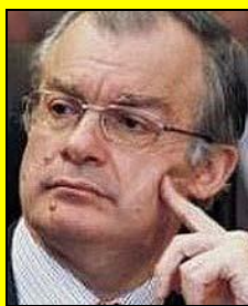
Ο Υπουργός Πολιτισμού κ. Κων/νος Τασούλας