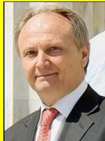
Ο υφυπουργός Αθλητισμού κ. Γιάννης Ανδριανός