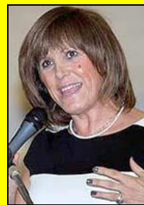
Η γενική γραμματέας Αθλητισμού κα Κυριακή Γιαννακίδου

Η ΜΠΟΥΡΔ-ΕΛΟΚ είναι ΑΝΑΓΝΩΡΙΣΜΕΝΗ από τη ΓΓΑ!!! Τα Παράνομα Μέλη του Παράνομου Διοικητικού της Συμβουλίου και οι Παράνομοι Συνεργάτες τους: