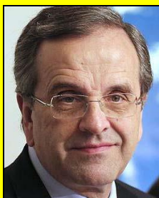
Γνωρίζει ο πρωθυπουργός αυτά που κάνετε εκεί στην αμαρτωλή ΓΓΑ?