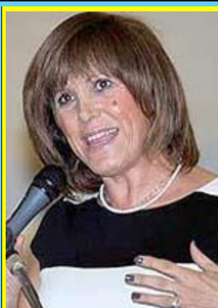
Η γενική γραμματέας Αθλητισμού κα Κυριακή Γιαννακίδου