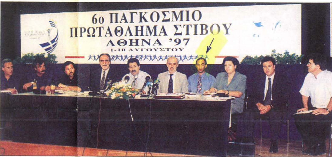
Τα οικονομικά στοιχεία του Παγκόσμιου Πρωταθλήματος Στίβου έδωσε χθες στη δημοσιότητα ο υφυπουργός Αθλητισμού κ. Ανδρέας Φούρας. Το στιγμιότυπο από τη συνέντευξη Τύπου

συγχρονισμό της ΕΡΤ και των αθλητικών εγκαταστάσεων, αθλητιατρική υποδομή και αθλητικά όργανα».